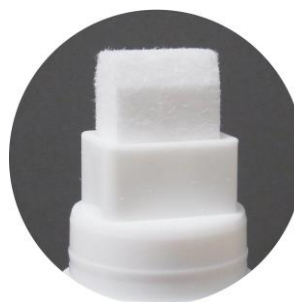
<ペン先：約 15 x 8 x 10 mm>