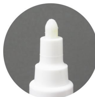
<ペン先：約 3.0 x 7.0 mm>

外観及び仕様は改良のため予告なしに変更する場合がありますのでご了承願います。 表示価格に消費税は含まれていません。