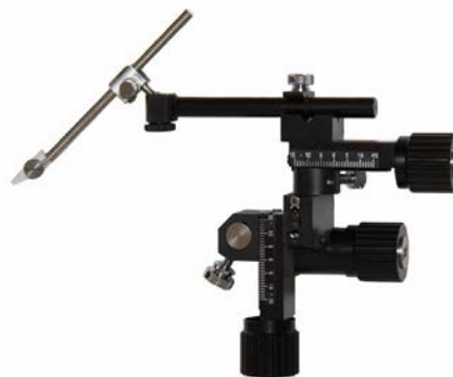
マニピから微動を除いたタイプ