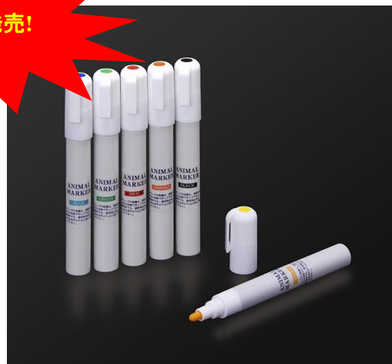
Fine Tip(細字) FG2200

アニマルマーカーは「法定色素」を使用した安全性に優れた実験動物用マーカーです。実験動物に対して有害な物質を一切含んでおりません。「法定色素」とは食品・医薬品・化粧品等に使用することのできる色素として、厚生労働省令に定められている色素で個々の色素の名称（構造）、品質規格および試験方法等が厳密に規定されています。動物の大きさや、塗布する面積により異なりますが、1本のアニマルマーカーで300～500匹程度のラットを処理できます。通常6週間程度は識別力を保ちます。