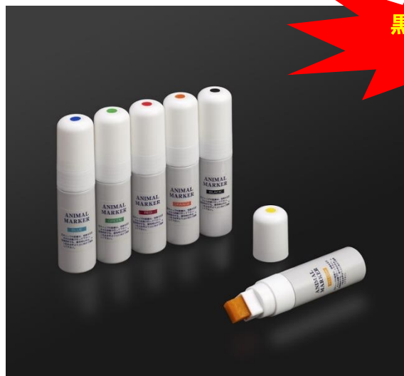
Standard Tip FG2000