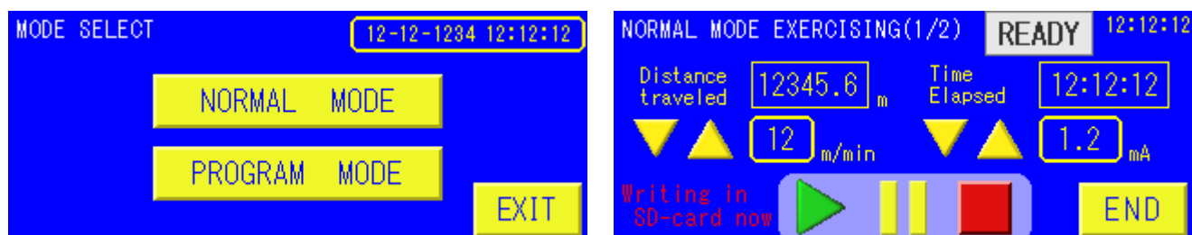
コントローラ画面例

※3 SD カードは最大 8GB 位迄の容量の物をご使用下さい。※容量が大きいと読み込み速度が遅くなり書き込みミスの原因となります。