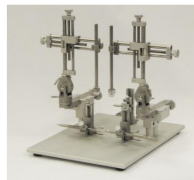
デュアルマニピュレータ仕様