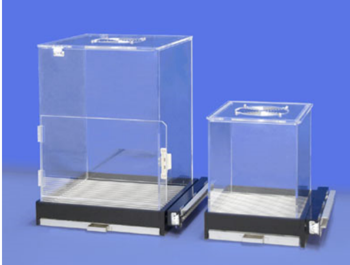
左：ラット用ケージ 右：マウス用ケージ