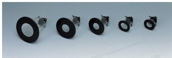
動物用マスク *各ヘッドバンド(小)付