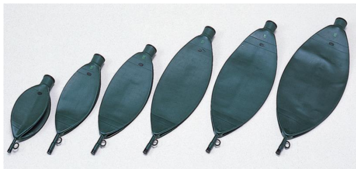
麻酔用呼吸バッグ