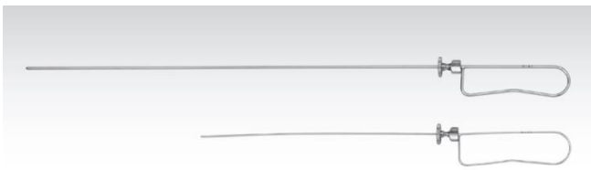
気管挿管用スタイレット