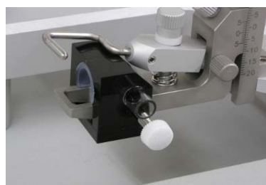
【ラット用ガス麻酔マスク】 型式: GAM-R/MK