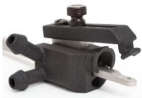
【マウス用ガス麻酔マスク】 型式: 51609M